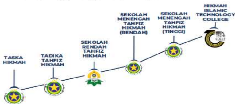
Rajah 3: Hala Tuju Pendidikan HIKMAH