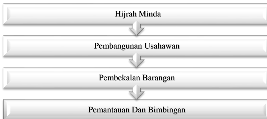
Rajah 3: Carta Alir Pelan Tindakan dan Pelaksanaan Skim Latihan Keusahawanan Baitulmal