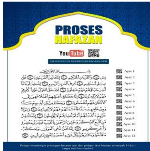
Gambar 2: Contoh Bar Kod QSAH

Proses seterusnya adalah fasa pengukuhan hafazan dimana pelajar dikehendaki mengulang-ulang hafazan secara menulis semula ayat-ayat hafazan dan juga memperdengarkan bacaan hafazan dihadapan rakan atau ibu bapa pelajar. Ini dapat mengukuhkan lagi ingatan hafazan pelajar. Fasa yang keempat adalah pentashihan hafazan. Hafazan pelajar perlu disahkan betul dan tepat oleh pensyarah. Oleh itu, pelajar perlu memperdengarkan semula hafazan dihadapan guru secara langsung. Kaedah ini bersesuaian dengan kaedah talaqi musyafahah yang dilakukan oleh para pelajar al-Quran sejak zaman Rasulullah SAW. Fasa yang terakhir adalah pelajar perlu mengamalkan bacaan hafazan mereka dengan membacakan ayat-ayat hafazan dalam solat fardhu atau sunat. Di samping itu, pelajar boleh menjadikan zikir harian dengan membacakan ayat hafazan. Di bawah seperti gambar 3 adalah rumusan proses pelaksanaan QSAH dalam buku aktiviti yang disediakan