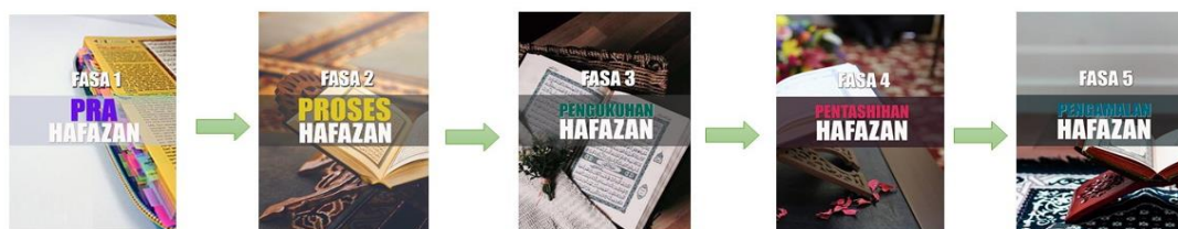
Gambar 3: Rumusan Proses Pelaksanaan QSAH

Proses seterusnya adalah fasa pengukuhan hafazan dimana pelajar dikehendaki mengulang-ulang hafazan secara menulis semula ayat-ayat hafazan dan juga memperdengarkan bacaan hafazan dihadapan rakan atau ibu bapa pelajar. Ini dapat mengukuhkan lagi ingatan hafazan pelajar. Fasa yang keempat adalah pentashihan hafazan. Hafazan pelajar perlu disahkan betul dan tepat oleh pensyarah. Oleh itu, pelajar perlu memperdengarkan semula hafazan dihadapan guru secara langsung. Kaedah ini bersesuaian dengan kaedah talaqi musyafahah yang dilakukan oleh para pelajar al-Quran sejak zaman Rasulullah SAW. Fasa yang terakhir adalah pelajar perlu mengamalkan bacaan hafazan mereka dengan membacakan ayat-ayat hafazan dalam solat fardhu atau sunat. Di samping itu, pelajar boleh menjadikan zikir harian dengan membacakan ayat hafazan. Di bawah seperti gambar 3 adalah rumusan proses pelaksanaan QSAH dalam buku aktiviti yang disediakan