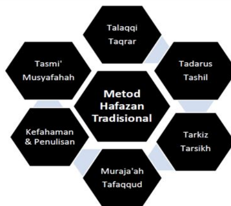
Rajah 1: Metod Hafazan Tradisional

Kaedah-kaedah yang berbentuk tradisi ini menjadi teras dalam pembelajaran hafazan al-Quran. Metod yang diamalkan ini boleh dibantu melalui inovasi dalam pembelajaran hafazan al-Quran yang lebih kontemporari agar dapat disesuaikan dengan perkembangan dan perubahan pelajar pada hari ini. Oleh itu, terdapat beberapa pendekatan yang baru perlu dilakukan dalam pembelajaran hafazan al-Quran agar dapat memberikan pendekatan yang lebih semasa. Dapat dirumuskan beberapa kaedah tradisi yang digunakan oleh institusi tahfiz seperti rajah 1 dibawah: