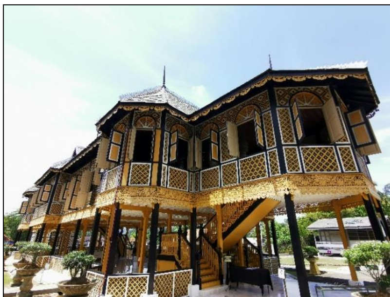
Gambar 1: Istana Kenangan Bukit Chandan