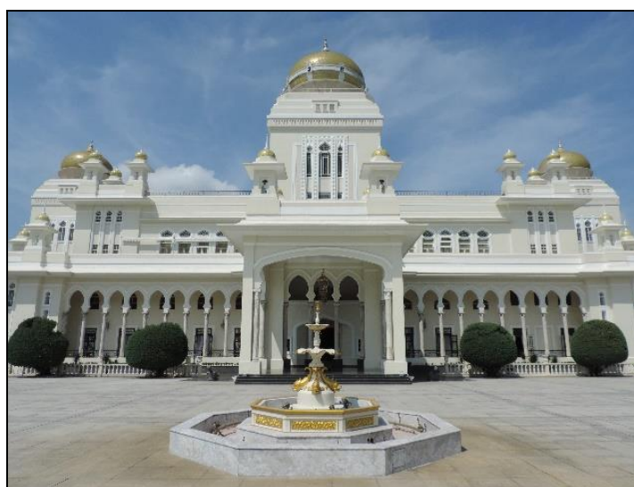
Gambar 2: Istana Iskandariah Kuala Kangsar

Istana Bukit Chandan Indera Mulia merujuk kepada Istana Changkat Negara yang dibina oleh Sultan Idris Shah I iaitu ayahanda baginda. Istana Changkat Negara ini kemudiannya dirobuhkan dan tapaknya dibangunkan Istana Iskandariah yang diambil sempena nama Sultan Iskandar. Sebelum Istana Iskandariah siap dibina pada tahun 1933, Istana Kenangan adalah tempat persemayaman sementara Sultan Iskandar dari tahun 1931 hingga 1933. Istana Kenangan Bukit Chandan atau nama lainnya Istana Lembah atau Istana Tepas dititahkan pembinaannya oleh Sultan Iskandar pada tahun 1926 dan siap sepenuhnya pada tahun 1931. Kini Istana Kenangan menjadi Muzium Diraja Perak yang dirasmikan pembukaannya oleh Almarhum Sultan Azlan Shah pada tahun 1986 dan menjadi Warisan Kebangsaan pada tahun 2009. Ia menjadi tempat tarikan pelawat yang ingin melihat kehalusan seni binanya apabila berkunjung ke Bandar Diraja Kuala Kangsar.