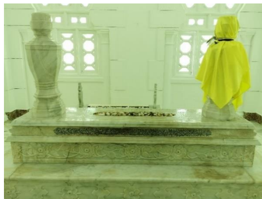
Gambar 5: Makam Sultan Iskandar di Makam Diraja Bukit Chandan