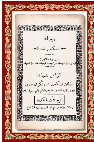
Gambar 4: Kitab Risalah Iskandar Syah