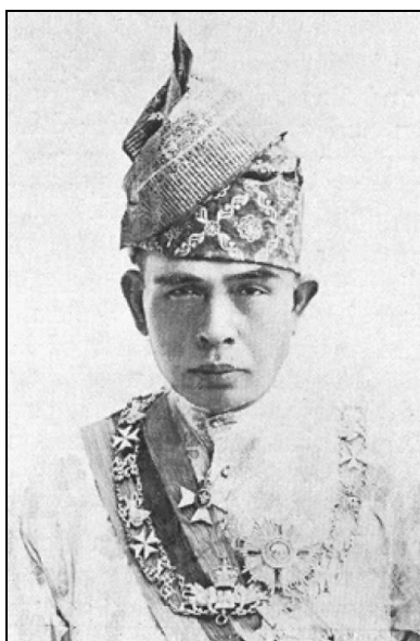
Gambar 3: Sultan Perak ke-30 Sultan Iskandar Shah

Artikel ini menggunakan kaedah kajian tekstual dan metode analisis dokumen untuk mengkaji kandungan dan asal usul manuskrip. Data kajian berbentuk kualitatif bersumberkan kitab Risalah Iskandar Syah terbitan Matba'ah Persama, Pulau Pinang. Kitab ini selesai dikarang pada tahun 1926 iaitu 8 tahun selepas Sultan Alang Iskandar menaiki takhta sebagai Paduka Seri Sultan Yang Dipertuan Negeri Perak yang ke-30. Kitab Risalah Iskandar Syah mula ditulis pada tahun 1921 walaupun di dalamnya mengandungi titah-titah baginda sejak dari tahun 1920. Penulisan kitab ini disempurnakan pada tahun 1345 Hijrah di Istana Bukit Chandan Indera Mulia, Kuala Kangsar pada pukul 1:33 pagi.